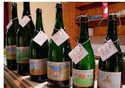
Recioto Casalin Le etichette diseguate dai bimbi alcuni anni fa

L'elaborato vincitore sarà scelto e stampato sull'etichetta attaccata a queste bottiglie speciali di vino. L'idea è di arrivare alla vendita di beneficenza del Recioto Casalin 2023 alla Festa medioevale del vino Soave di maggio. «Le nostre viti», conclude Menini, «portano non solo profitti alle nostre aziende, ma anche frutti di solidarietà a persone e realtà deboli del territorio». Z.M.