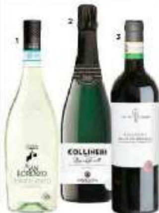
1) San Lorenzo Soave Classico della Cantina di Soave. 2) Collinetti, vino spumante di Cantina di Montebelluna. 3) Amarone della Valpolicella di Cantina di Illasi.

E ancora, Cantina di Montebelluna vince a mani basse se il tema è la vivacità delle bollicine. Qui nascono eccellenti spumanti, ottenuti da uve Diavola, talvolta tagliati con sapienti percentuali di Chardonnay, Garganega, Pinot bianco e Pinot nero. Collinetti, Diavola in purca-