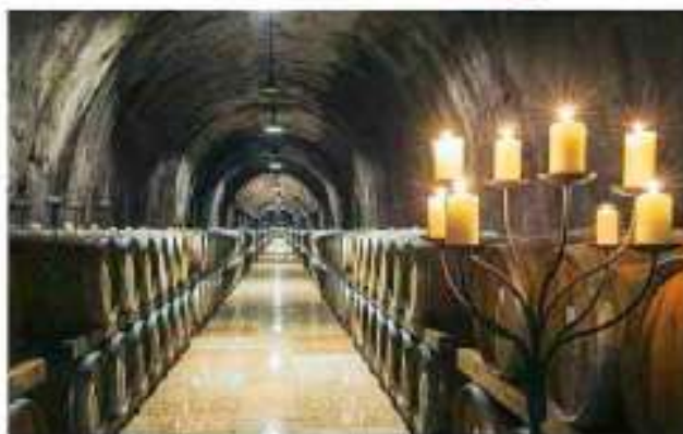
La barriera di Rocca Sveva, uno dei brand che fa capo al Gruppo Cadis 1898.

The barrique cellar in Rocca Sveva, one of the brands that belong to the Cadis1898 Group.